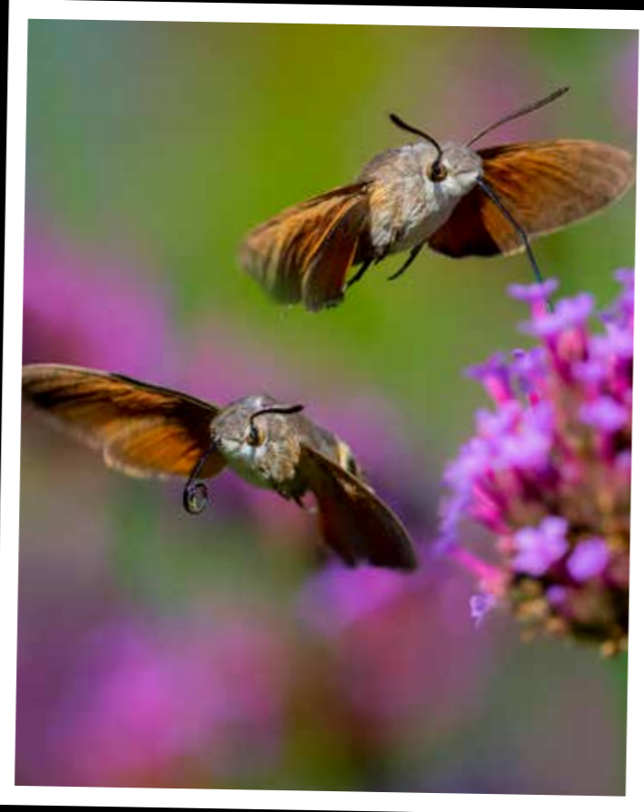
Sinds ik Verbena bonariensis plantte, zie ik steeds vaker de kolibrievlinder in mijn tuin.